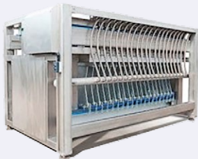
▶ Van Abeelen · Plattenfroster

Hochwertige Maschinen von namhaften Herstellern exakt für Ihre Anwendungen.