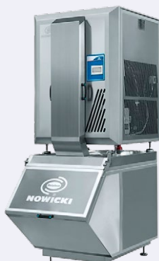
▶ Nowicki · Scherbeneiszeuger