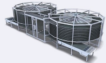
▶ Van Abeelen · Doppelspirale

Installiert und im Anschluss gewartet von tk FOODTEC Lebensmitteltechnik.