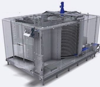
▶ Van Abeelen · Spiralfroster

Unsere Maschinen bringen Effizienz in Ihre Produktion – mit einer Maschine von tkFOODTEC treffen Sie eine gute Entscheidung.