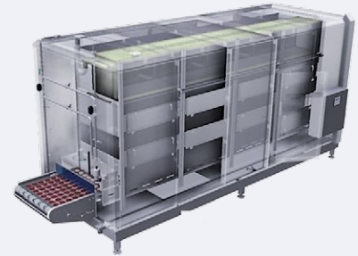
▶ Van Abeelen · Impingement-Froster